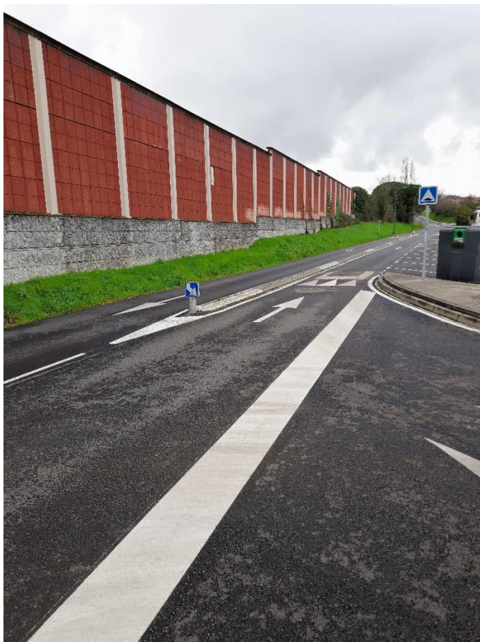
Voie Latérale Nord : Demande de panneau STOP, pour ce croisement, adressée à Toulouse Métropole le 22 février.