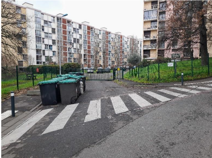
Endroits relevés présentant des dépôts sauvages récurrents.