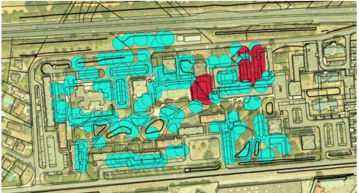
Réaménagements des espaces publics et plantations prévues secteur EN JACCA

Ces nouveaux aménagements issus de la concertation mise en œuvre en 2022 amènent à repenser les cheminements. Afin de créer des îlots de fraîcheurs, les plantations sont renforcées notamment en pied d'immeuble permettant d'éviter que la chaleur accumulée par le goudron ne se répercute sur l'habitat. La trame d'espace vert existante sera conservée pour conserver la fraîcheur en pied des arbres. L'objectif est d'augmenter les parcelles d'espaces verts.