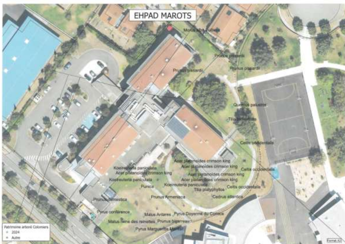
Plan de plantation EHPAD Anne Laffont

L'EHPAD Anne Laffont a sollicité le Pôle Espaces Publics pour renforcer le couvert végétal des jardins.