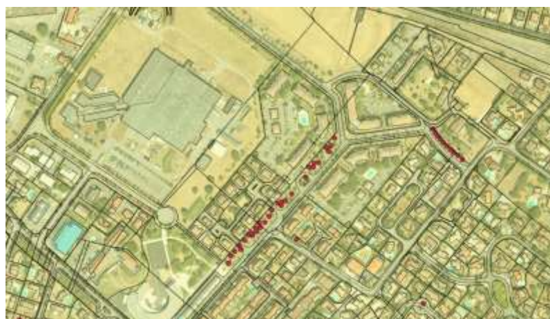
Plantations arbres 2023 avenue des Marots

Dans le cadre de la compensation des travaux du métro, TISSÉO a demandé à la ville les endroits à privilégier dans les secteurs 1 et 3 de la ville pour les plantations d'arbres -secteurs dans l'emprise du métro-. Pour le secteur 3, l'avenue des Marots a été ciblée, elle a donc pu bénéficier dans ce cadre de plantations cette année. L'achat des plants et l'entretien est assuré par TISSÉO.